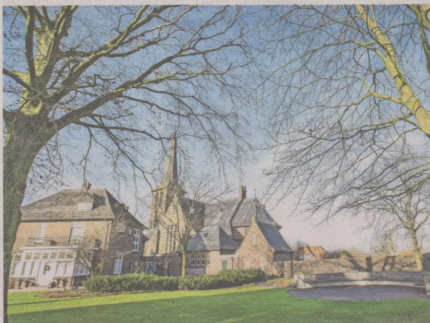
▲ De parochietuin in Sint Isidorushoeve, waar de appartementen gepland zijn.

„De pastoriëtuin wordt na de bouw keurig hersteld”, verzekert Wielens. „We hebben gekeken naar andere locaties, in nieuwbouwwijk De Hoeve Noord bijvoorbeeld. De grondprijs ligt daar echter fors hoger. We willen juist betaalbare huurappartementen realiseren, in het sociale domein, zodat mensen eventueel aanspraak kunnen maken op huurtoeslag.”