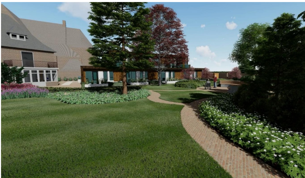
Aanzicht appartementen vanaf Goorsestraat – “Garage Aktief” - zijde